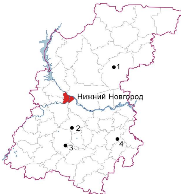
Рисунок 1 – Места сборов на карте Нижегородской области. 1 – Воскресенский р-н, 2 – Дальнее Константиново, 3 – Арзамасский р-н (заказник Пустынский), 4 – Сергачский р-н