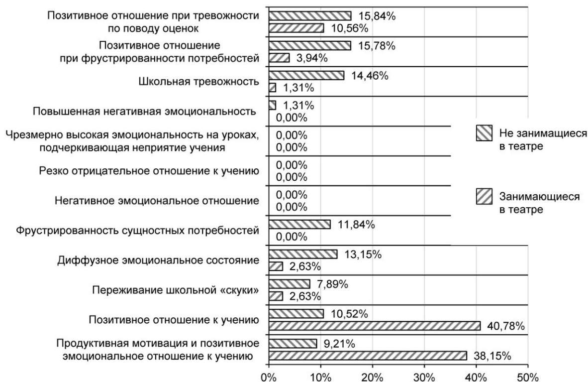
Рисунок 1 – Процентное распределение подростков по уровням учебной мотивации и отношения к учению

Различия между группами зафиксированы и по показателям диффузного, то есть нестабильного отношения к учебной деятельности подростков двух исследовательских групп. Если среди занимающихся в школьном театре такая нестабильность, проявляющаяся в среднем уровне учебно-познавательной активности при среднем уровне тревожности и гнева, что может быть обусловлено внешней учебной мотивацией, страхом наказания или, напротив, желанием получить похвалу от педагогов или родителей, зафиксирована только у двух респондентов, то есть у 2,63%, то среди респондентов второй группы – у 13,15%. Несмотря на то, что исследование проводилось в группах подростков с достаточно высоким уровнем школьной успеваемости, среди респондентов второй группы, то есть тех, кто не участвовал в постановках школьных театров, почти 10% составили такие обучающиеся, которые испытывали так называемую «школьную скуку». Их высокая успеваемость по школьным предметам никак не обусловлена интересом к содержанию учебного материала или к общей учебной деятельности, что также свидетельствует о преобладании у них внешних мотивов учения. Большинство подростков данной исследовательской группы характеризуются позитивным отношением к учебной деятельности при фрустрированности значимых для них потребностей (15,78%) и при страхе и повышенном внимании к школьным оценкам (15,84%).