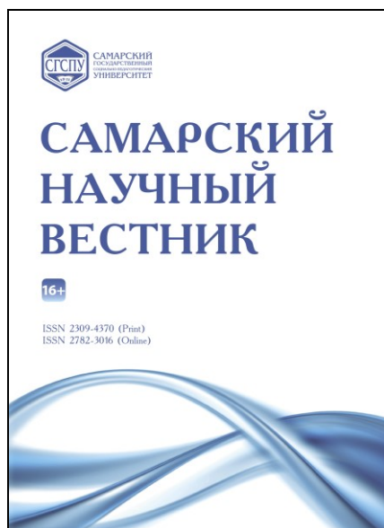
Рисунок 1 – Журнал «Самарский научный вестник»