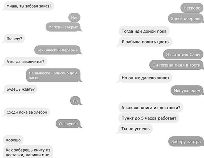
Рисунок 1 – Пример переписки, предлагаемой обучающимся для анализа на уроках русского языка

3. В тексте сочинения есть недостоверная информация, фактические ошибки. Найдите их и исправьте.