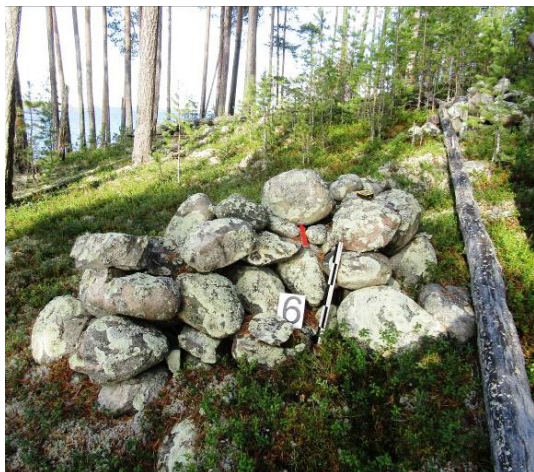
Рисунок 2 – Озеро Среднее Куйто. Каклолакши I. Валунное сложение 6