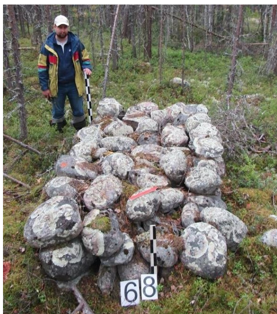
Рисунок 6 – Озеро Боярское. Валунное сложение 68