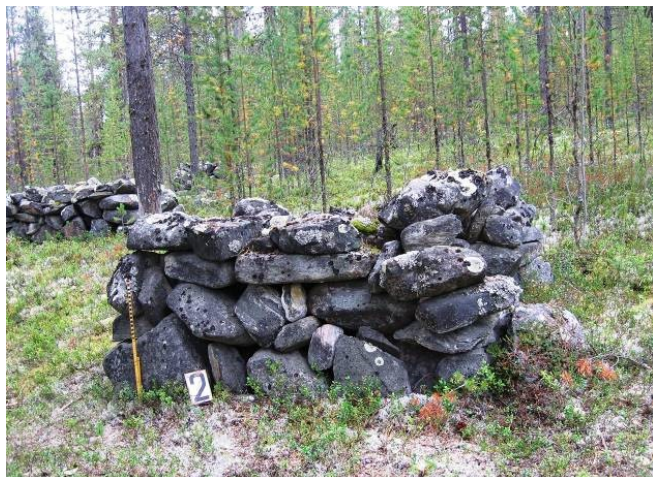
Рисунок 4 – Озеро Окунёвое. Группа 2. Валунное сложение 2