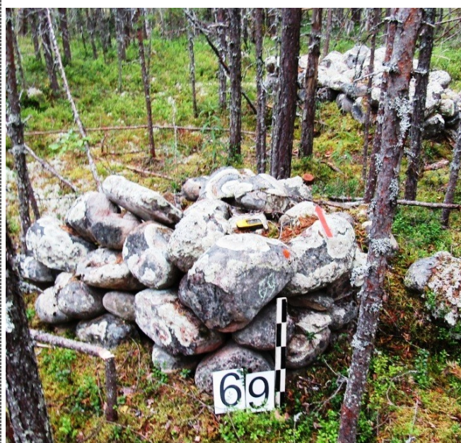
Рисунок 7 – Озеро Боярское. Валунное сложение 69