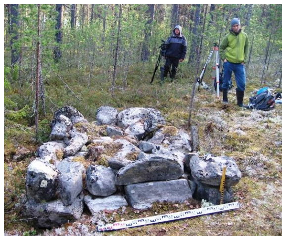
Рисунок 5 – Озеро Окунёвое. Группа 1. Валунное сложение 4