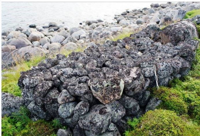
Рисунок 3 – Остров Кильдин. Черный I. Валунное сложение 14